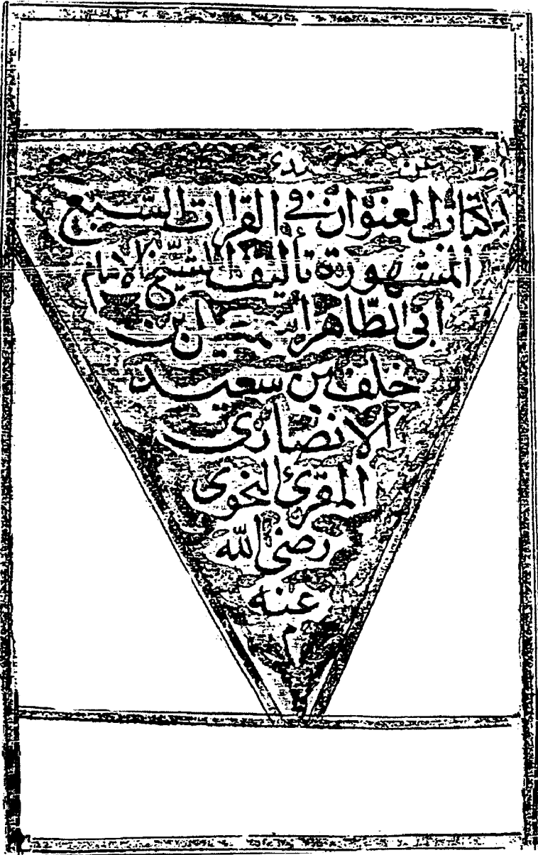
صفحة العنوان من كتاب العنوان ( وهو مختصر الاكتفاء )